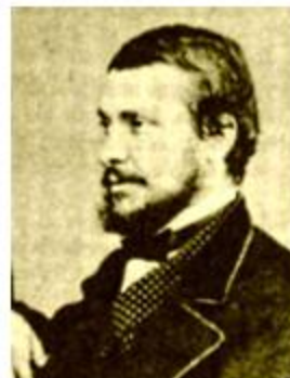
PAUL ROBIN 1837-1912 Pedagogo francés

Activa luchadora de la Comuna de París en 1871, educadora popular, feminista y una de las figuras más importantes del anarquismo francés.