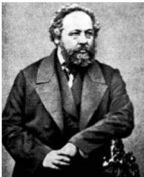
MIJAIL A. BAKUNIN 1814 - 1876 Anarquista ruso

El más conocido de la primera generación de filósofos anarquistas, dentro de la cual defendió la tesis colectivista. Es el primer gran impulsor del anarquismo como movimiento político y popular.