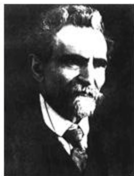
ERRICO MALATESTA 1853 - 1932 Anarquista italiano

Publicó un conocido periódico anarquista, Freiheit , popular entre los libertarios de Austria, Bohemia y Hungría. Originalmente que se publicaba en Londres, y que luego siguió publicándose en Nueva York, aunque seguía teniendo una amplia acogida entre los alemanes en el exilio. Observando la línea editorial se puede apreciar su evolución desde unas originales posturas incendiarias, hasta un pensamiento final de preferencia por la educación y la estrategia de una organización revolucionaria con principios formativos ajenos a dogmas e insensateces gratuitas y pseudorevolucionarias.