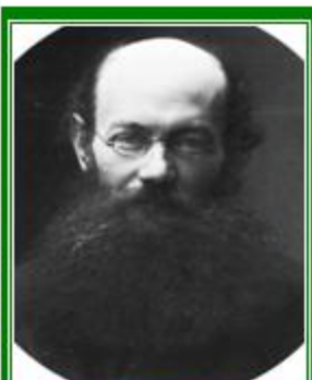
PIOTR A. KROPOTKIN 1842 - 1921 Anarquista ruso

Entre 1880 y 1894 trabaja en el Orphelinat de Cempuis , ensayando algunas de sus teorías educativas. Sus Principios pedagógicos influyeron en Francisco Ferrer i Guardia, el creador de la Escuela Moderna. Fue también un firme partidario de la liberación de la mujer, creando en 1889, en París, el primer centro de información sobre productos anticonceptivos.