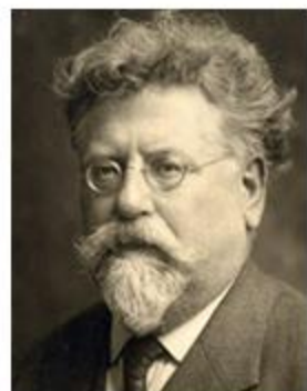
RUDOLF ROCKER 1873 - 1958 Anarquista alemán

En 1936, Goldman colaboró con el gobierno republicano español, en Londres y Madrid, durante la Guerra Civil española.