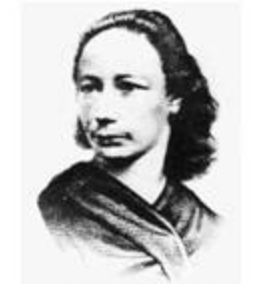
LOUISE MICHEL 1830 - 1905 Anarquista francesa

Además de su defensa del naturismo y el vegetarianismo, fundó la Universidad Nueva (conocida como Universidad Libre).