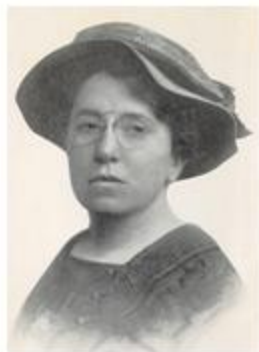
EMMA GOLDMANN 1869 -1940 Anarquista estadounidense

Fundador de la escuela libertaria "La Ruche"; e iniciador de la Encyclopédie anarchiste