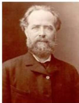
ELISÉE RECLUS 1830 - 1905 Anarquista francés

Nacido en el seno de una antigua familia perteneciente a la nobleza rusa, tras ver la contradicción de su vivir cotidiano con su ideología, Tolstói decidió dejar los lujos y mezclarse con los campesinos de Yásnaya Polaina, trabajando la mayor parte del día en el oficio de zapatero. Intentó renunciar de sus propiedades en favor de los pobres, pero su familia lo impidió. Murió intentando huir de su casa.