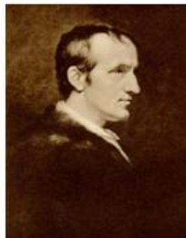
WILLIAM GODWIN 1756 - 1836

Llegamos así a 1910, momento de la creación de la organización que más cerca ha estado de conseguir el sueño libertario. Pero antes queremos detenemos a observar a algunos de los personajes más relevantes surgidos en este pensamiento hasta esa fecha. Será un breve resumen, incompleto e imperfecto (pues no están todos y no siempre se hace énfasis en lo que se debe) que hemos dividido en dos partes, dejando para otro número las importantes influencias surgidas en el estado español y latinoamericano.