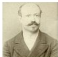
SÉBASTIEN FAURE 1858 - 1942 Anarquista francés

Editor del diario anarquista "Liberty"; Tucker filtró e integró las teorías de pensadores europeos con la de los anarcoindividualistas estadounidenses, además de difundir los ideales de amor libre, libre pensamiento, el rechazo de la legislación de carácter religiosa y la denuncia de las penosas condiciones de vida de los trabajadores que él vio como resultado de cuatro monopolios capitalistas: dinero, terratenientes, patentes, y los aranceles y tarifas.