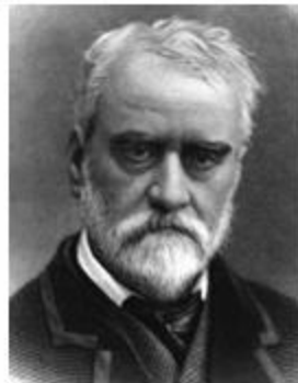
WILLIAM B. GREENE 1819-1878 Anarquista estadounidense

Para Bakunin el anarquismo supone una sociedad libre, sin gobierno ni autoridad oficial, cuyo centro de gravedad se sitúa en el trabajo, el factor de producción, sus medios y distribución