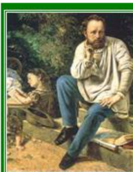
PIERRE-JOSEPH PROUDHON 1809 -1865

Considerado como una figura excepcional de su tiempo, su interpretación libertaria del derecho natural parte de que los individuos tienen derecho a la vida y la libertad, y los capitalistas, el Estado y sus monopolios lo impide. Por tanto se debe desobedecer y levantarse contra el capitalismo, el Estado, el ejército, etc. En 1870 escribió "The Constitution of No Authority", afirmándose como pensador anarquista radical: cualquier gobierno es una asociación de ladrones y asesinos; toda legislación se opone al derecho natural y, por tanto, es criminal. Este libro tendrá gran influencia en los filósofos anarquistas norteamericanos.