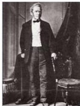
JOSIAH WARREN 1798 - 1874

Creía en la capacidad de perfeccionarse del ser humano, en la idea de que no existen principios innatos, y por ello en la idea de que no existe una predisposición al mal. Para él, todo control del hombre por el hombre era intolerable, y habría de llegar el día en que cada hombre, haciendo lo que pareciera justo a sus propios ojos, estaría haciendo de hecho lo que es mejor para la comunidad, porque todos se guiarían por los principios de la razón pura. Este optimismo extremo combinaba con una fuerte creencia en el determinismo y la idea de que las acciones malignas de los hombres son producidas por condiciones sociales corruptas que eran heredadas y que cambiando dichas condiciones se podría acabar con la maldad en el hombre.