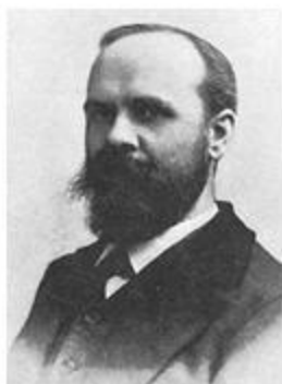
BENJAMIN R. TUCKER 1854 - 1939 Anarquista estadounidense

Oponiéndose a los individualistas defiende que el socialismo libertario se basa en la voluntad de impedir que unos individuos opriman a otros, teniendo en cuenta que es imposible la existencia del individuo fuera de la sociedad.