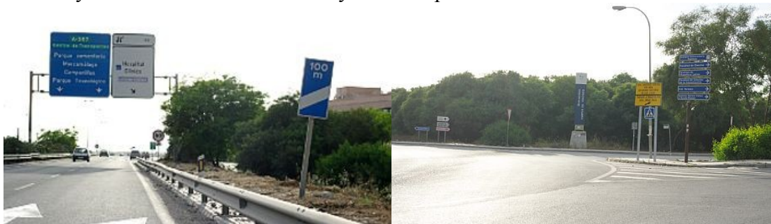
Fotos 3 y 4: Salida 68, a la izquierda, y rotonda de entrada al campus, recomendable buscar aparcamiento por la primera calle a la derecha y acercarse andando a la sede del congreso

Más o menos a un kilómetro de esta indicación os encontrareis con la primera salida, la número 68 de la carretera autonómica A-357 que indica Hospital Clínico/Universidad... Debéis tomar esa salida que se señala en la foto 3 y tras un corto descenso llegáis a la rotonda que da acceso al campus que se reproduce en la foto 4. En esta rotonda podéis tomar por la primera salida hacia las facultades de Ciencias, Letras, Turismo (con buenos aparcamientos) y luego paseando acercarse hasta la ETSI Ingenierías, o bien salir por la segunda y llegar hasta el Hospital Clínico (también con buenos aparcamientos), Si queréis llegar con coche hasta la sede del Congreso (poco recomendable por las obras del metro) deberéis girar en la rotonda ante el Hospital Clínico y volver en sentido contrario y tomar la primera desviación a la derecha