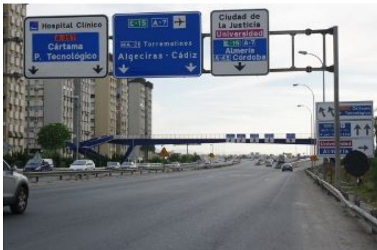
Foto 2: Tomar los carriles de la izquierda Carta/P Tecnológico/Hospital

Desde el centro: Preguntar en el hotel por la Avenida de Andalucía y seguir por ella hasta que os saque de la ciudad. Cuando veáis los primeros carteles de carretera (en la zona de la Comisaría Central), seguir la indicación que marca Cártama/Parque tecnológico/Hospital Clínico (no la que señala Universidad que está inutilizada por obras) los carriles totalmente de la izquierda tal y como se ve en la foto 2