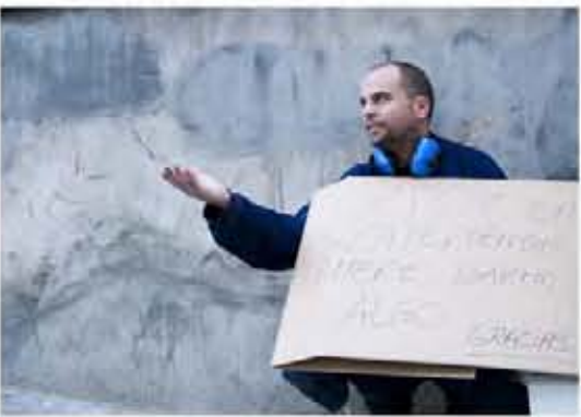
Destrozo del empleo, familias desamparadas, yo esto no me lo creo y aquí nadie hace nada.