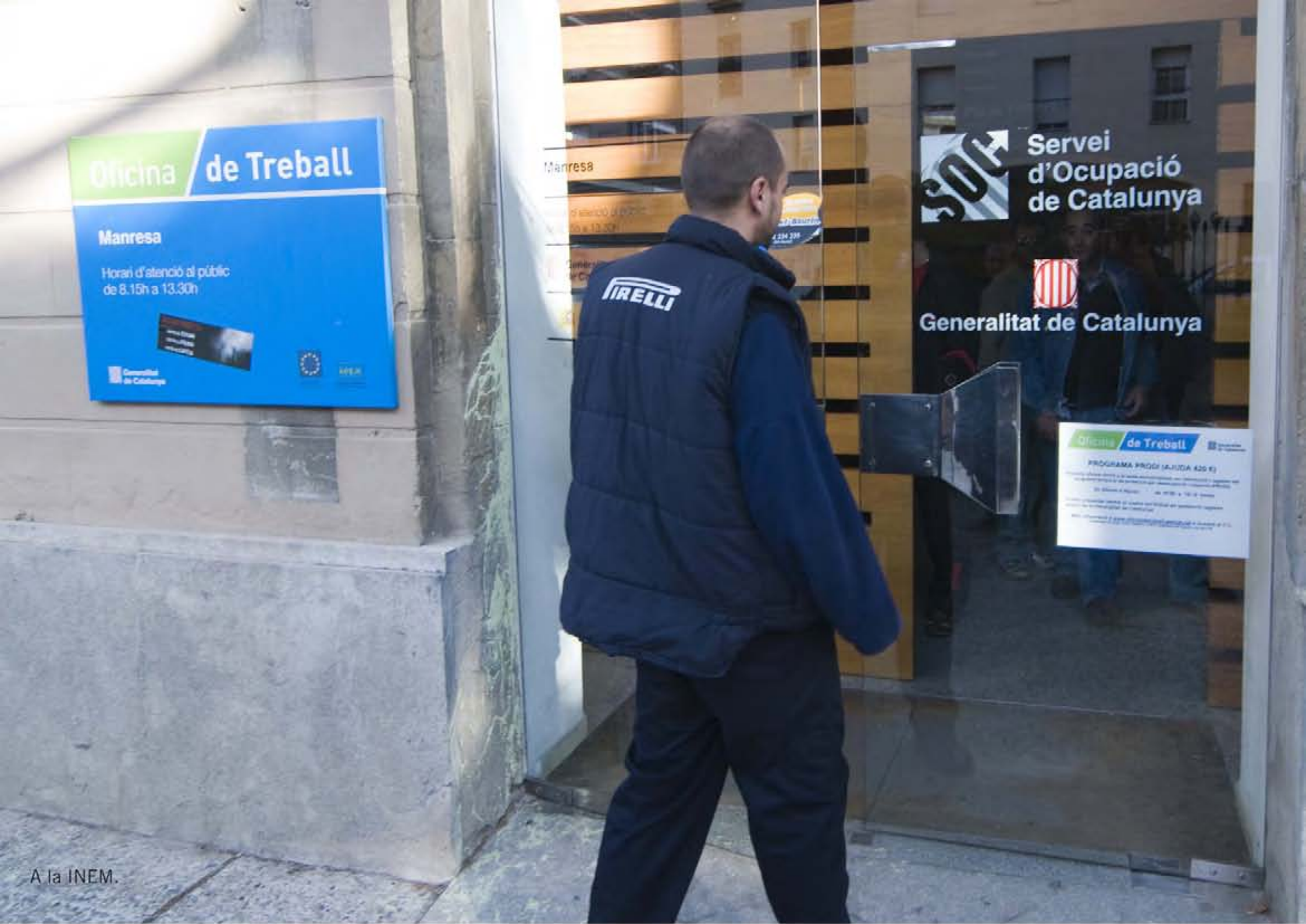
A la INEM.