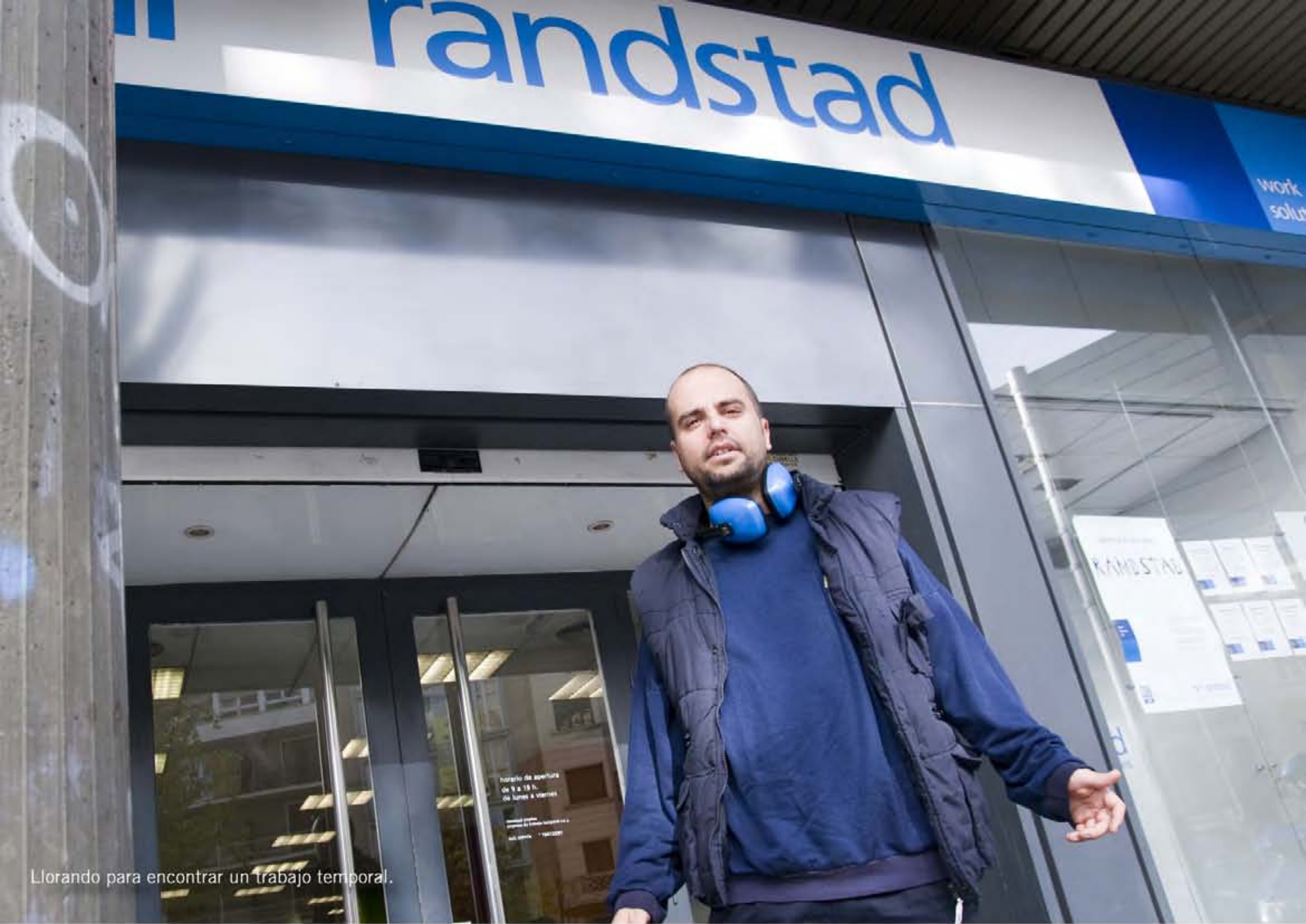
Llorando para encontrar un trabajo temporal.