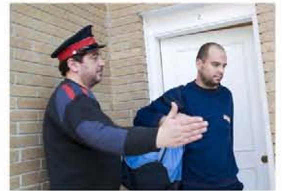
La pole de despidos que Pirelli liderais, discriminando sin sentido y a la calle nos echais.