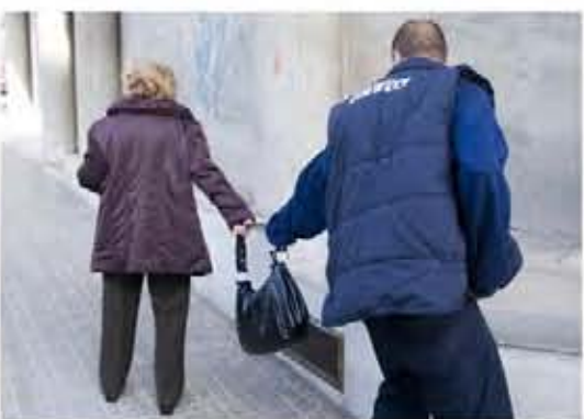
El mundo se nos viene encima al perder nuestro trabajo, caemos desde la cima en dirección al carajo.