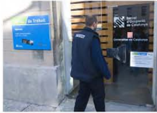
Maldita sea vuestra suerte, una vaca dando leche, os vienen a encomendar, que la teneis que destripar.