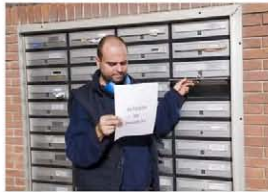
Mercenarios sin escrúpulos que pasean por Milán. Mandan sicarios con puro, fijate, el por culo que dan.