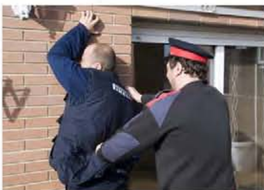
Por pertenecer a Europa el país pierde soporte, las empresas viento en popa deslocalizan como deporte.