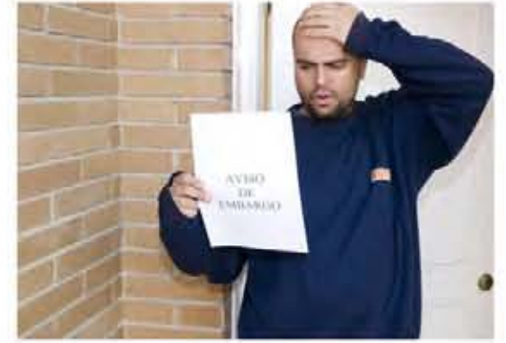
Capaz de aguantar una lucha sin igual y os dejais achantar por eso de la crisis global.