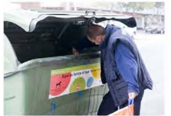
Descarada deslocalización, vergüenza me daría, os apuntasteis al "Low Cost" explotando Rumanía.