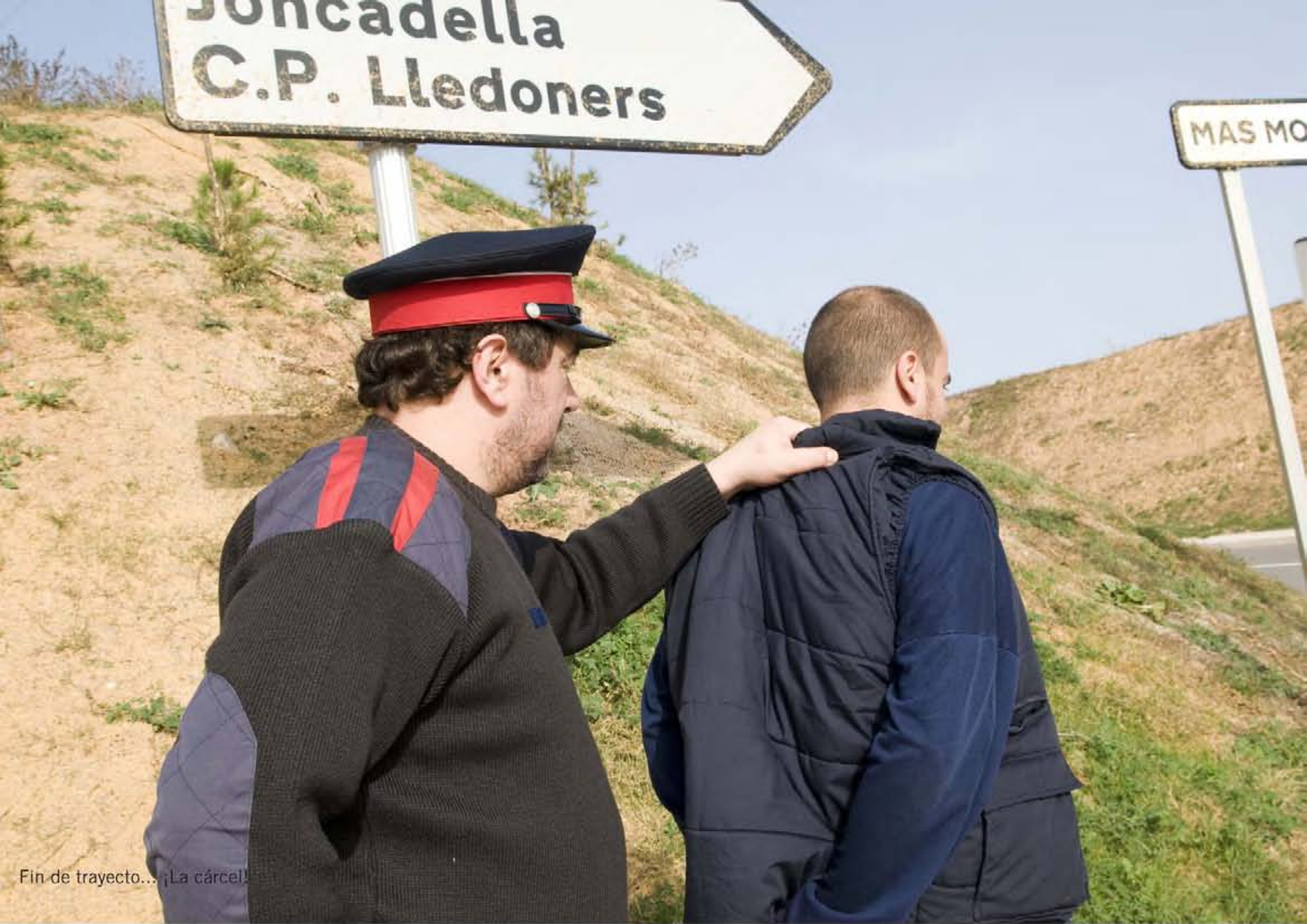
Fin de trayecto... ¡La cárcel!