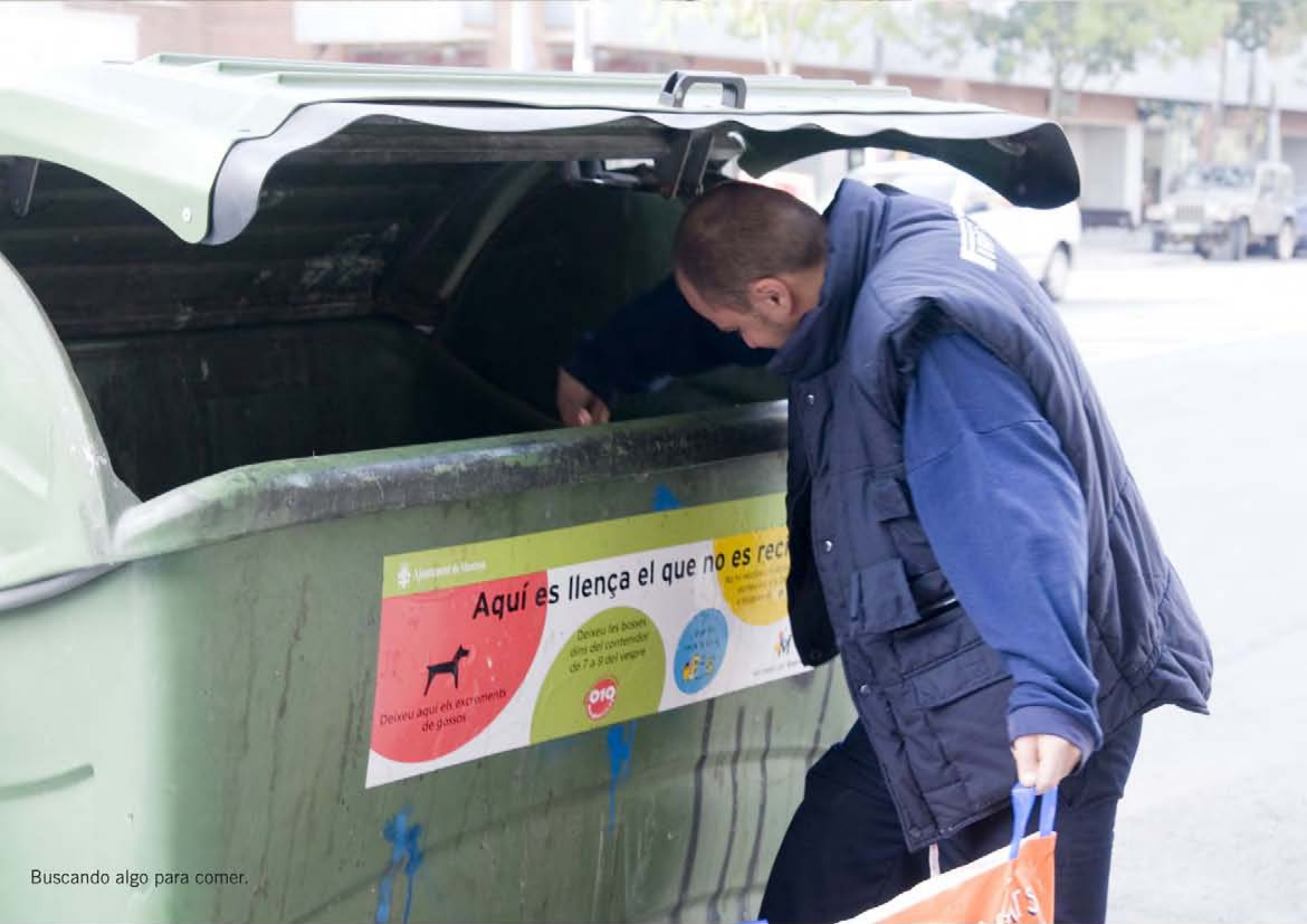
Buscando algo para comer.