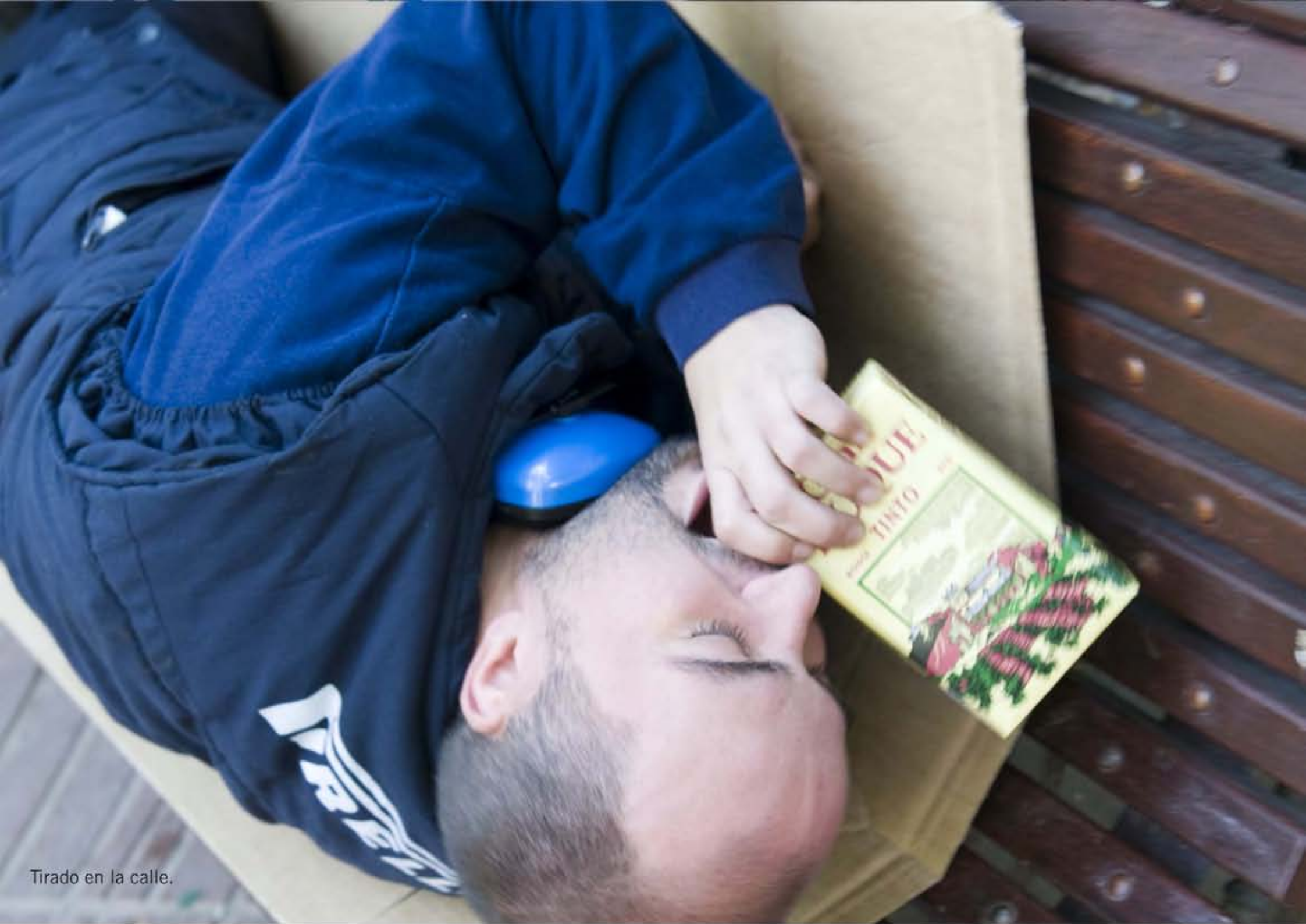
Tirado en la calle.