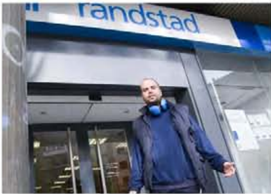
Calendario de un cierre, calendario para la Jet, ojalá esto no fuera, pero todos a la INEM.