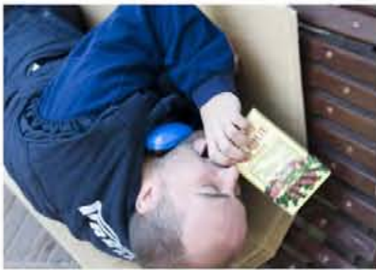
Malditos cierres de empresas, por la ganancia del capital, destroza a los obreros, los dejan sin dignidad.