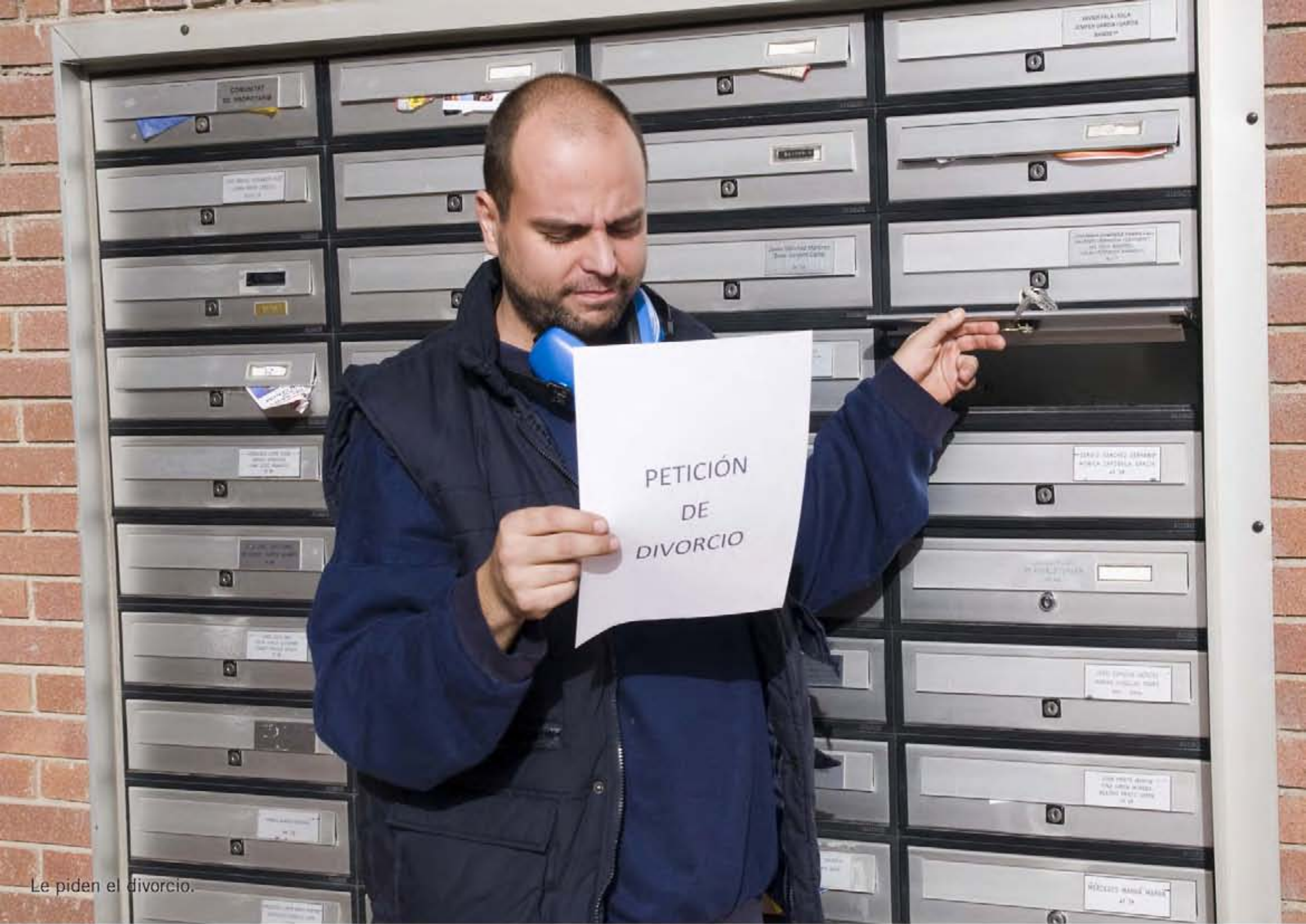
Le piden el divorcio.