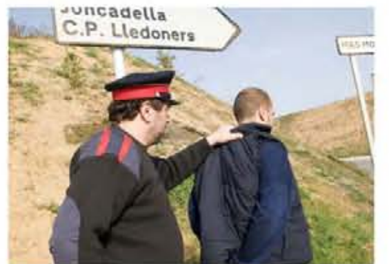
Las familias pasan hambre y ellos hacen calendarios, se gastan 20 millones y se suben los salarios. Ande, ande, ande, venga calendarios y los pirellistas a cobrar el paro.